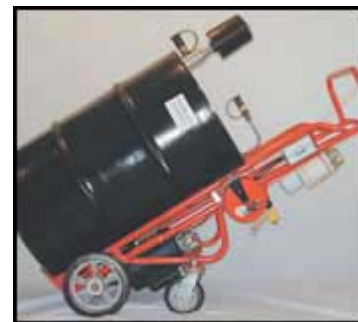
Obrázek 6. Kombinace vozíku sudů / filtračního vozíku. Přenosový systém předčistí olej.

Pro provozy, kde se využívá velké množství několika typů maziv, je nejvhodnější hromadný zásobník s distribučním potrubím do požadovaných míst. Při určování ideálního místa pro skladovou místnost je potřeba brát v úvahu několik bodů.. Tankery by měly mít snadný přístup k sudům a elektrické energii pro čerpací jednotky. Velkoobjemové obaly můžou být statické - s doplňováním maziva z tankeru nebo přenosné kontejnery - dodány, napojené, použité a pak se odstraní pro opětovné naplnění.