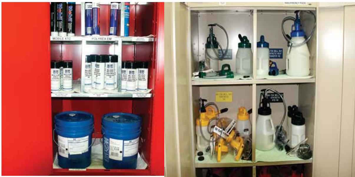
Obrázek 1. Skříň na odkládání maziv a pomůcek

Při sestavování plánů na renovaci skladu maziv, je důležité vzít v úvahu množství potřebných prostor, nábytek a pracovní stoly, směrnice pro skladování, osvětlení, ventilaci a energii a především zajištění ergonomie pro to všechno. Pro zajištění správného mazání je potřeba vytvořit co nejjednodušší pracovní prostory i postupy a pokud možno bezbolestně podpořit zodpovědnost a elán ve skladě. Vzhledem k tomu, že ve skladu může být zainteresováno víc lidí, rozhodující pro správné řízení je důslednost v postupech a hospodaření.