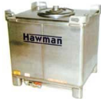
Obrázek 2. Přenosný zásobník středního objemu

Ať už provozujete malou automobilovou dílnu, velké elektrárny nebo povrchové doly, je nutný dostatečný skladovací prostor pro maziva, mazací zařízení a potřeby. Pro některé to mohou být jednoduše vhodné skříně nebo skříňky (obr. 1), pro jiné to mohou být velkokapacitní systémy s čerpadlovým dávkováním (obr. 2). Pro oba je společným základem potřeba zamezit venkovnímu skladování, použití odpovídajících stojanů pro kontejnery, zabezpečit vhodné manipulační a dávkovací zařízení stejně jako opatření pro odpady. Mnohem důležitější je potřeba dodržování bezpečnostních a zdravotních předpisů a zajištění toho, aby byli všichni členové personálu vyškoleni v protipožárních a bezpečnostních postupech. Žádná organizace nechce svoji cestu k úspěchu poskvřnit katastrofou.