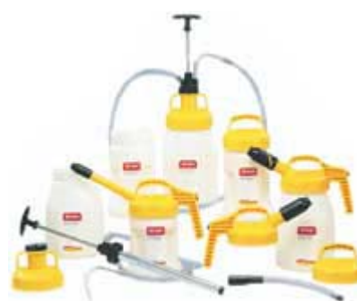
Obrázek 4. Přenosné nádoby

Ve větších provozech je často normou používání 55-gal. US (208 L) sudů. Pro tyto sudy je důležité uskladnění uvnitř. Police by měla umožnit uskladněným sudům takovou polohu, aby zátky byly v pozicích 3 a 9 hodin, pro zajištění vzduchotěsnosti. Venkovní skladování se nedoporučuje, protože v horní části bubnu se hromadí voda. To může vést ke korozi a znehodnocení maziva vodou. Pro manipulaci se sudy by měly být k dispozici vozíky.