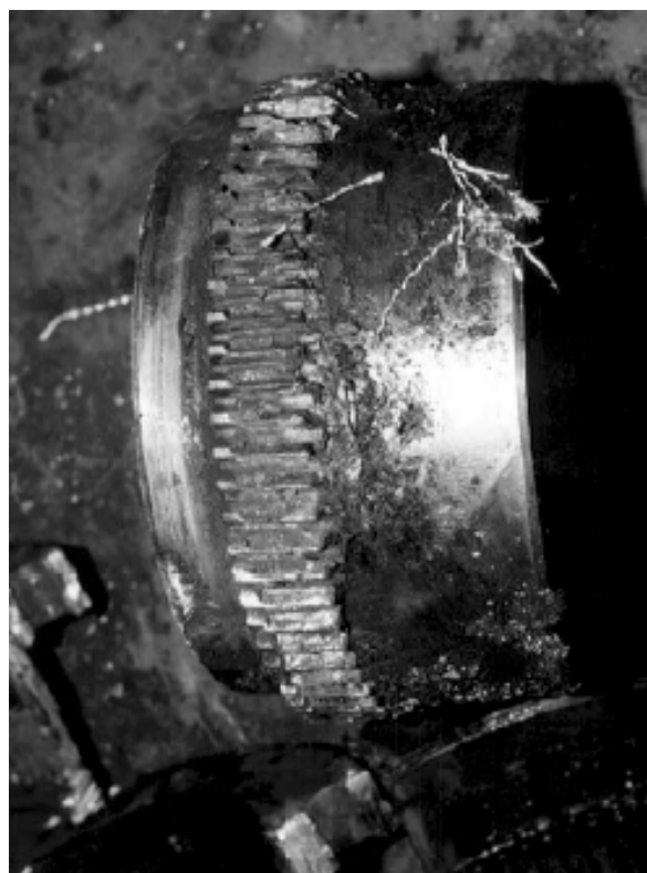
Obr. 1-6 Opotřebené zuby u zubové spojky, které pracovaly s nesouosostí 1,8 milsů/palec po dobu 12000 hodin

Z knihy Pjotrovski: Shaft Alignment Handbook